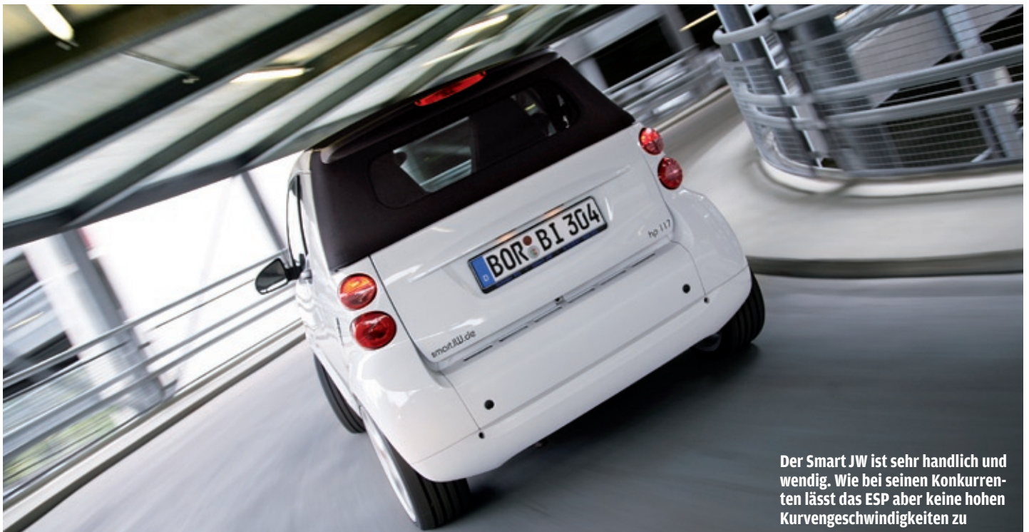
Der Smart JW ist sehr handlich und wendig. Wie bei seinen Konkurrenten lässt das ESP aber keine hohen Kurvengeschwindigkeiten zu