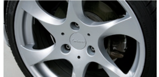
Die formschönen 17-Zoll-Räder aus dem Hause Lorinser schlagen mit 1500 Euro zu Buche