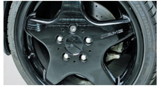
Dank Adapterscheiben passen die Fünfloch-AMG-Räder zur Dreiloch-Radanbindung des Smart