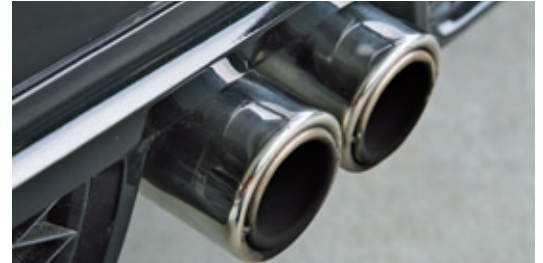
Rennbirne? Der Auspuff entlässt sportliche Töne, im heißen Zustand aber auch unangenehme Dröhnfrequenzen