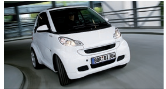
Das Fortwo Cabrio von Smart JW erstrahlt auf Wunsch (2000 Euro) in der Dodge-Farbe „Bright White“