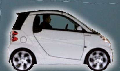
SMART JW FORTWO CABRIO

Menschen in Aspik: Auch wenn es nicht so aussieht - ein Fortwo bietet ausreichend Platz für zwei Personen und Reiseverpflegung