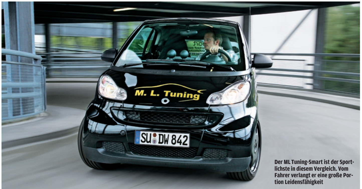
Der ML Tuning-Smart ist der Sportlichste in diesem Vergleich. Vom Fahrer verlangt er eine große Portion Leidenschaft