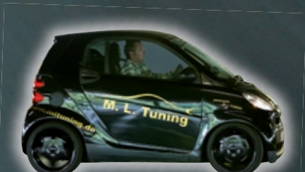
ML TUNING DARK CAT

Auffallen ist dennoch garantiert: Die Österreicher montieren heftige Kotflügelverbreiterungen und garnieren die Karosserie des Fortwo mit ▶