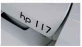
„hp 117“: dezenter Leistungshinweis am Heck. Das Cockpit blieb – mit Ausnahme der in Wagenfarbe lackierten Instrumenteneinfassungen – im Serienzustand