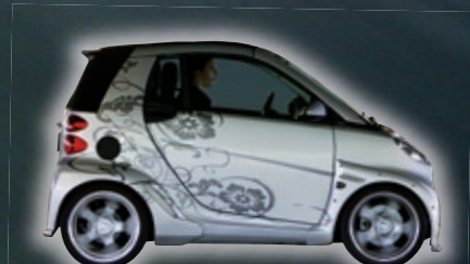
KÖNIGSEDER FORTWO CABRIO